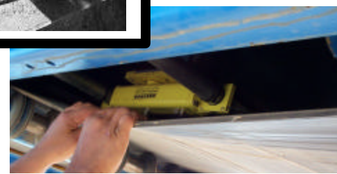
Modelo de bajo perfil

Nuestro display provee cuatro líneas de información. Esto simplifica la calibración y hace la información